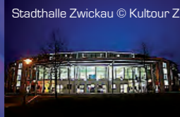
Stadthalle Zwickau

Stadthalle Zwickau Bergmannsstraße 1, DE-08056 Zwickau